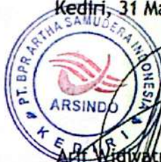
Art Widiatmoko, SE Direktur Utama